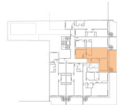
Planta Segunda Vivienda C