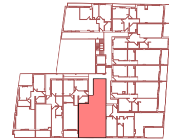
VIVIENDA H - PLANTA SEGUNDA